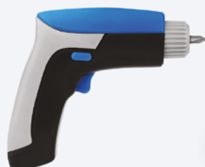
Obudowa wkrętkarki elektrycznej