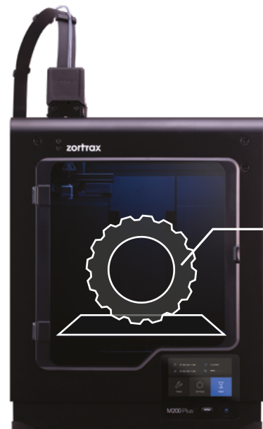
Drukarka 3D Zortrax M200 Plus