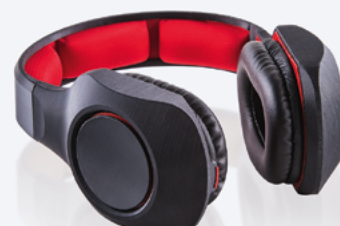
Funkcjonalny prototyp słuchawek